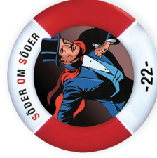
Mandrake-illusion Mystery | D3,5 T3,5 | Regular