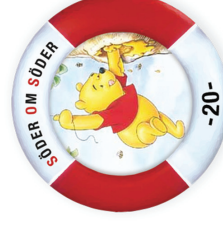
Puh's Honungsträd Traditional | D2 T4 | Other