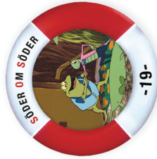
Grodan Boll Traditional | D1,5 T2,5 | Small