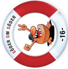
Herman Hedning Multi | D2 T3 | Small