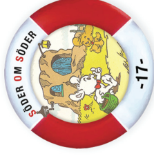
Lille Skutts inflyttningsfest Traditional | D1,5 T2 | Regular